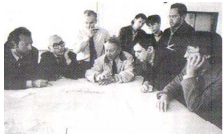
Incontri tecnici e incontri politici