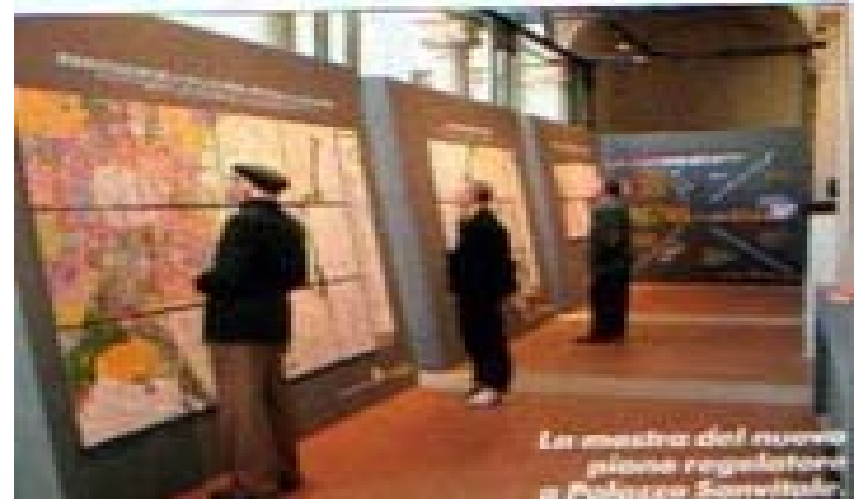
I chioschi interattivi e la mostra sul PRG