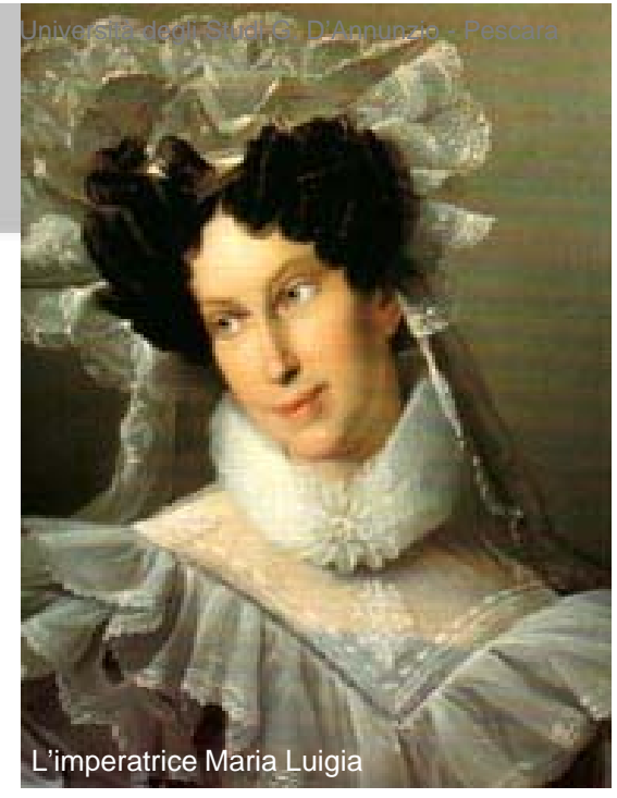
L'imperatrice Maria Luigia